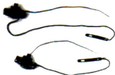
Circuit imprimé d'éclairage Beleuchtungsplatine Lighting printed circuit board Réf. 53 8370 32