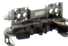
Plaque porte-tampon Puffer trager Buffer carrier Réf. 53 8370 31