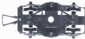
BOGIE PRISE DE COURANT ELECTRIC PICK-UP BOGIE STROMABNAHME DREHGESTELL