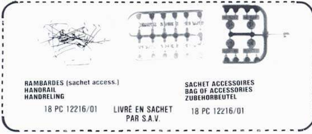
RAMBARDES (sachet access.) HANDRAIL HANDRELING